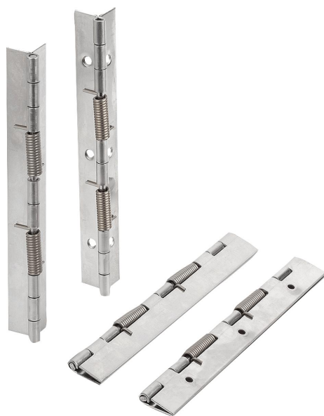
Dobradiças com mola de fechamento